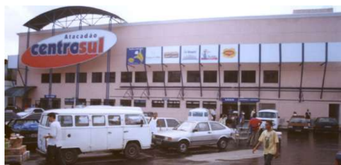
Inauguração da loja Centro Sul Calçada em 2001.

Em 2001 foi inaugurado, no bairro da Calçada, o Atacadão Centro Sul, empresa que se tornou rapidamente uma excelente opção de compras da região, oferecendo, em um só lugar, os melhores preços e variedade em atacado e varejo.