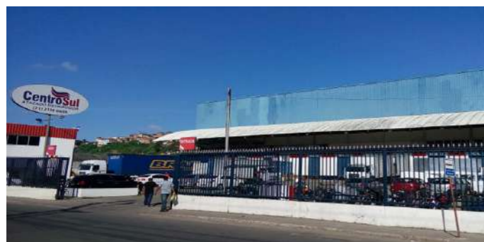
Inauguração do Centro Sul Distribuidor em 2010.

O grupo possui duas lojas, com mais de 15.000m 2 de área construída, atende cerca de 350 municípios do estado da Bahia, com frota própria de caminhões, um mix de mais de 15 mil itens e movimenta em torno de 1.000 empregos diretos e indiretos. Com sólida carteira de fornecedores,